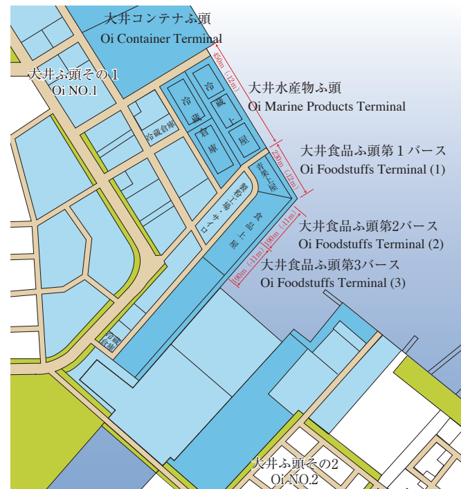
Location of Major Imported Foodstuffs Terminals