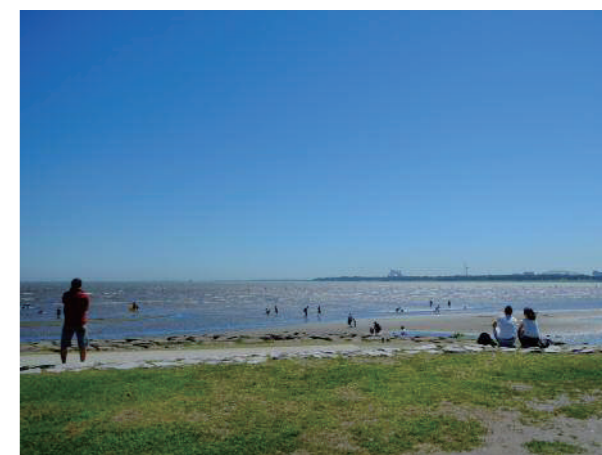
④ 葛西海浜公園 (西なぎさ) Kasai Marine Park (West Beach)