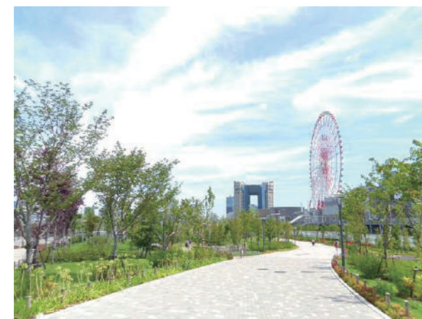
⑫ シンボルプロムナード公園 (センタープロムナード) Symbol Promenade Park (Center Promenade)