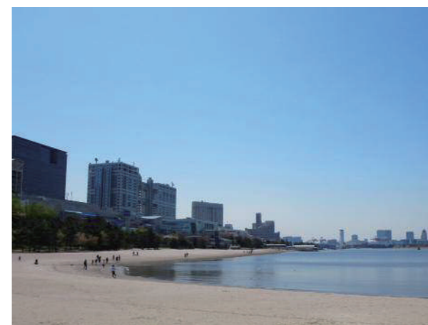
① お台場海浜公園 (お台場ビーチ) Odaiba Marine Park (Odaiba Beach)

As a long period of time has elapsed since the opening of the first park, and there has been a big change in the living environment of local residents and the urban structure of Tokyo, in May 2017, "New Marine Parks' Vision in Tokyo: aspiring the splendid nature and people's joy" was drafted as medium-to-long-term guidelines for the maintenance, operation and management of the parks. Based on this vision, we are strengthening our efforts on the natural environment such as conservation of biodiversity, and meanwhile create new prosperity through cooperation with regional and private sectors.