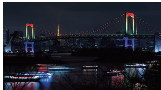
レインボーブリッジと屋形船 Rainbow Bridge and a houseboat

While improving the convenience of movement in the coastal area in terms of both touristic and everyday means of transportation, promote the expansion of a sea traffic network leveraging the diverse appeal of the Port of Tokyo.