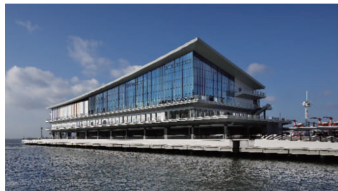
東京国際クルーズターミナル Tokyo International Cruise Terminal

観光と日常の足の両面から臨海部の移動利便性を向上させるとともに、東京港の持つ多彩な魅力を活かした海上交通ネットワークの拡充を推進する。