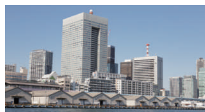
日の出ふ頭 Hinode Terminal