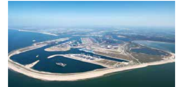
(イメージ図 ロッテルダム港湾公団提供)

ロッテルダム港 (1989.4.25提携) The Port of Rotterdam