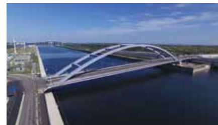
海の森大橋 (令和2年6月20日開通) Umi-no-Mori (Sea Forest) Ohashi Bridge (Open June 20, 2020)