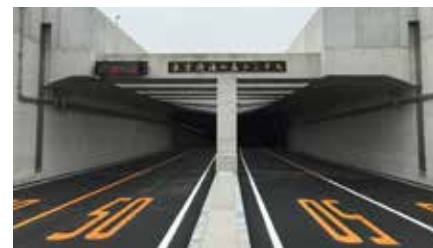
東京港海の森トンネル (令和2年6月20日開通) Tokyo Port Umi-no-Mori (Sea Forest) Tunnel (Open June 20, 2020)