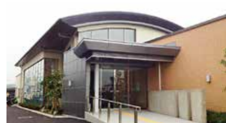
品川台場食堂 "Shinagawa Daiba Restaurant"