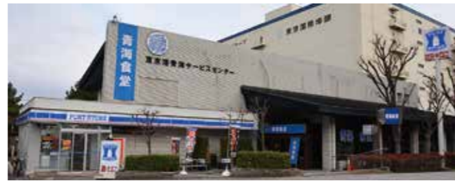
青海サービスセンター "Aomi Service Center"

Lodgings, restaurants and other welfare facilities are provided with the aim of creating a pleasant workplace and living environment.