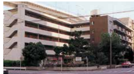
第三宿泊所(むつみ荘) The Third Lodging "Mutsumiso"