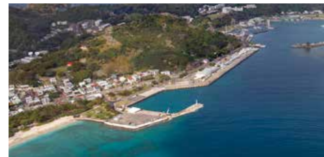
二見港 Port of Futami

The Ogasawara Islands were registered as the world natural heritage in June 2011.