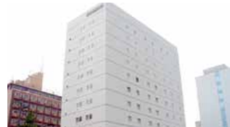
東京海員会館 "Tokyo Kaiin Kaikan"