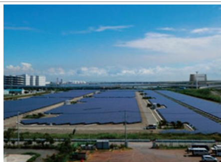
② 再生可能エネルギーの活用や災害対策を目的とした自家発電設備導入等の推進