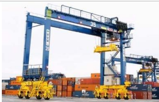
① 港湾施設の機能高度化、物流システム高度化施設の整備、物流効率化機械設備等の導入

京浜港のコンテナターミナル等において、以下の①、②を実施する事業者が、地域再生協議会の構成員である金融機関から融資を受けて施設整備を実施する場合に、貸付の日から 5 年間、国が 0.7%以内で金融機関に対し利子補給金を支給する。