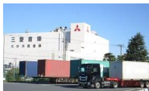
既存ストックヤードの様子（大井）