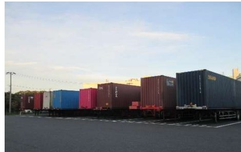
ストックヤードの様子