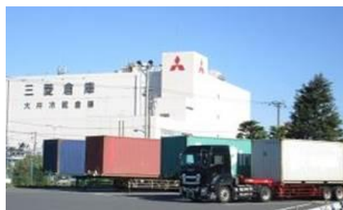
既存ストックヤードの様子（大井）