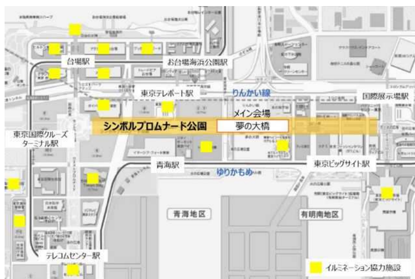
イルミネーション開催マップ