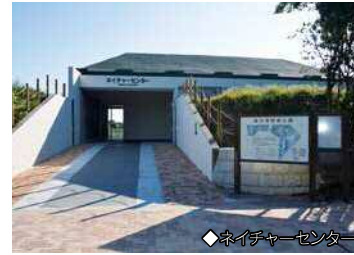
◆ネイチャーセンター