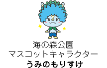
海の森公園 マスコットキャラクター うみのもりすけ

開園面積は約127ha! 海上公園の中で広さは最大級です。詳細はP5をご覧ください。