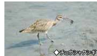
◆チヨウシヤクシヤク