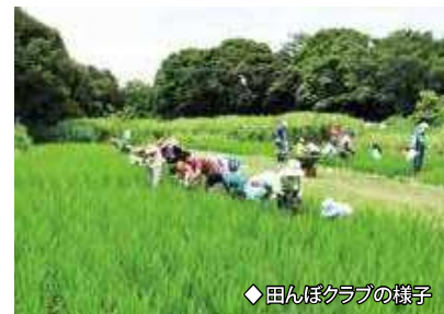
◆田んぼクラブの様子

東アジア・オーストラリア地域 フライウェイ・パートナーシップ (渡り性水鳥保全連携協力事業) 日本の渡り鳥が移動する地域のアメリカ、ロシア、中国、韓国、東南アジア、オーストラリアなどの国々やNGOがいっしょになって、水鳥やその生息地となっている湿地の保全を進める国際協力事業。東京港野鳥公園は、谷津干潟や大阪南港野鳥園、熊本県の球磨川河口などととも、シギ・チドリ類の重要な生息地として参加しています。