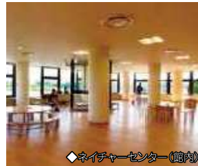
◆ネイチャーセンター(館内)