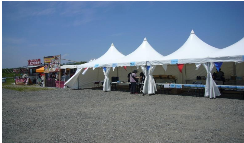
海の森紹介ブースのほか、飲食ブースも設置