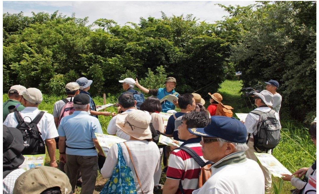
ガイドツアーの様子