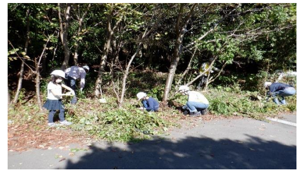
生きもの調査や育樹作業