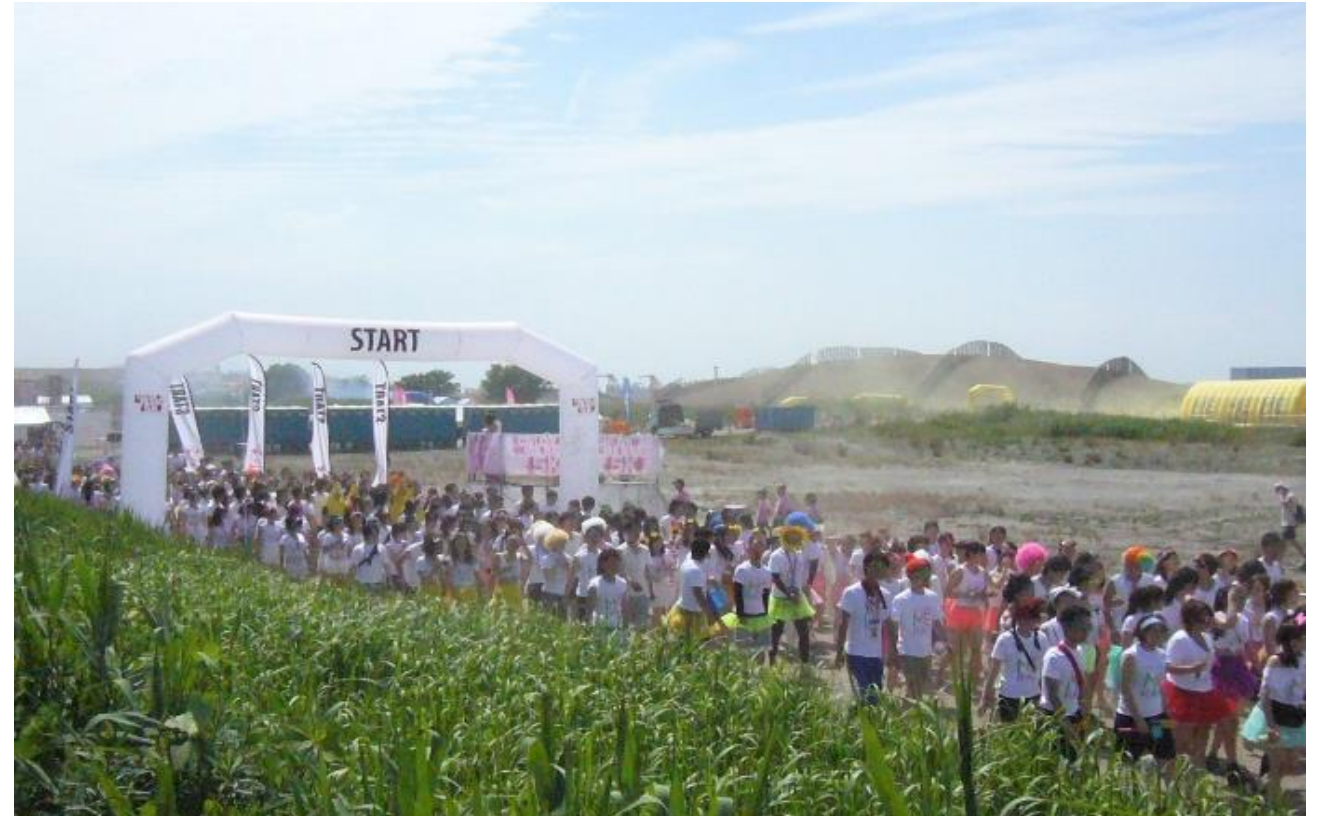
カラーパウダーを身にまといながらランニングをしている様子