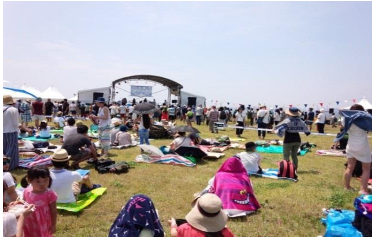
芝生上に大勢の人が集まりライブステージを見ている様子