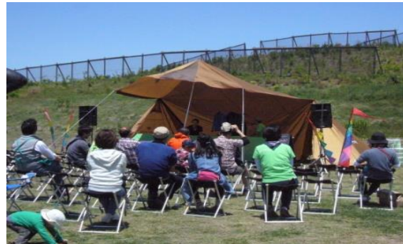
野営体験等、災害時に役立つスキルの学習