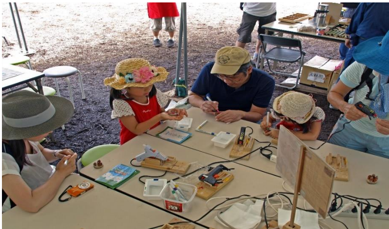
森づくりで発生した木の実などを使った作品づくり