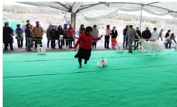
ドッグスポーツフェスタ