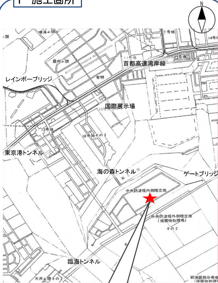
施工箇所:海の森公園