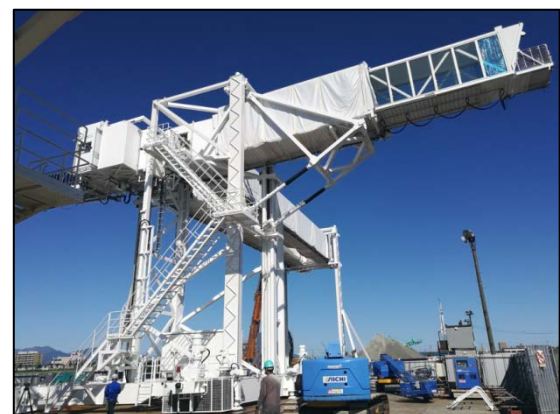
ボーディングブリッジの工事状況