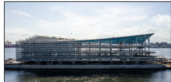
東京国際クルーズターミナル 整備状況