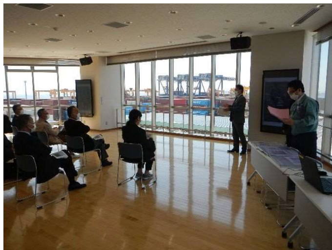
【中央防波堤外側Y1・Y2コンテナターミナル】