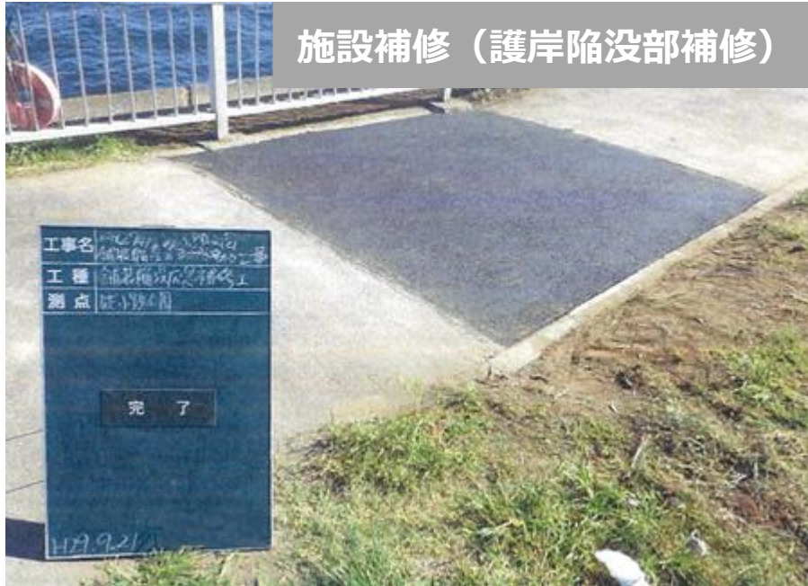
施設補修（護岸陥没部補修）