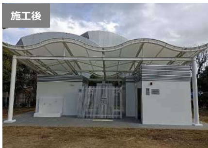
トイレの洋式化、バリアフリートイレの設置