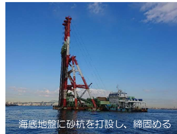
護岸建設工事（締固工） 令和2年12月