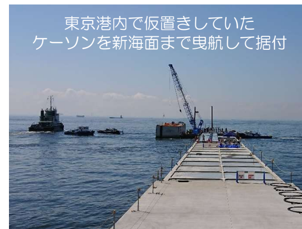
護岸建設工事（ケーソン据付工） 令和3年5月