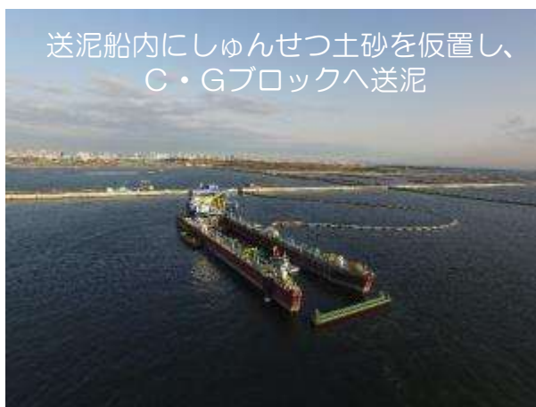
送泥工事（送泥船） 平成30年1月