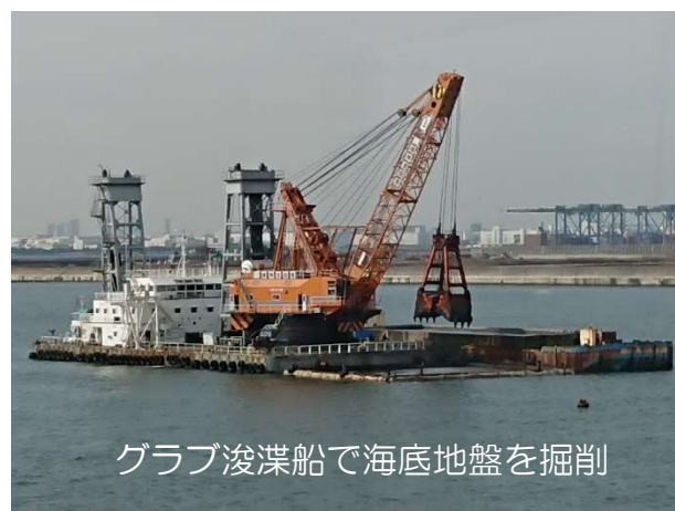
深掘工事 令和3年11月