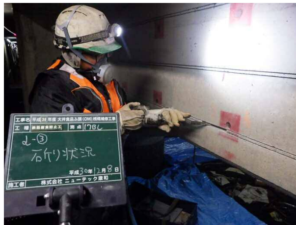
鉄筋腐食防止工（はつり状況） 平成30年12月