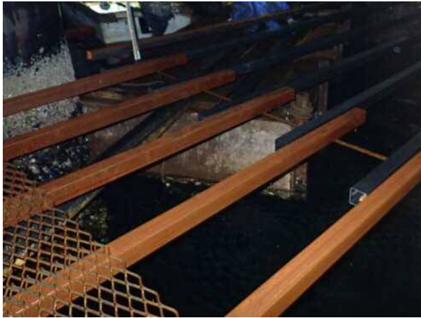
足場設置状況 平成30年11月