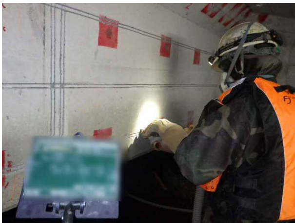
鉄筋腐食防止工（カッター切断状況） 平成30年12月