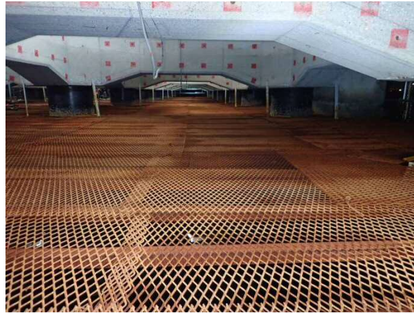
足場設置完了 平成30年11月