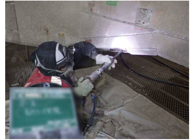
断面修復工（コンクリートはつり状況） 平成30年12月