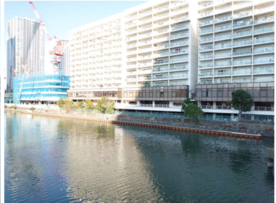
本体工（第四工区） 令和3年3月