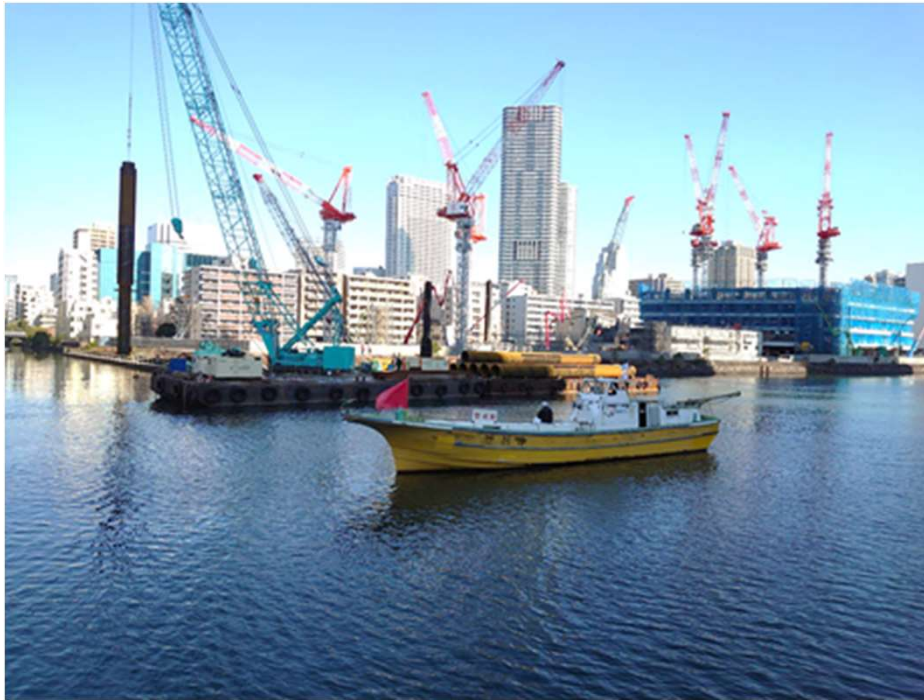
本体工（第二工区） 令和3年3月