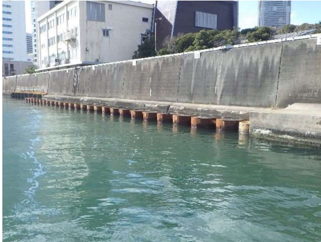
本体工(鋼管矢板) 令和3年1月