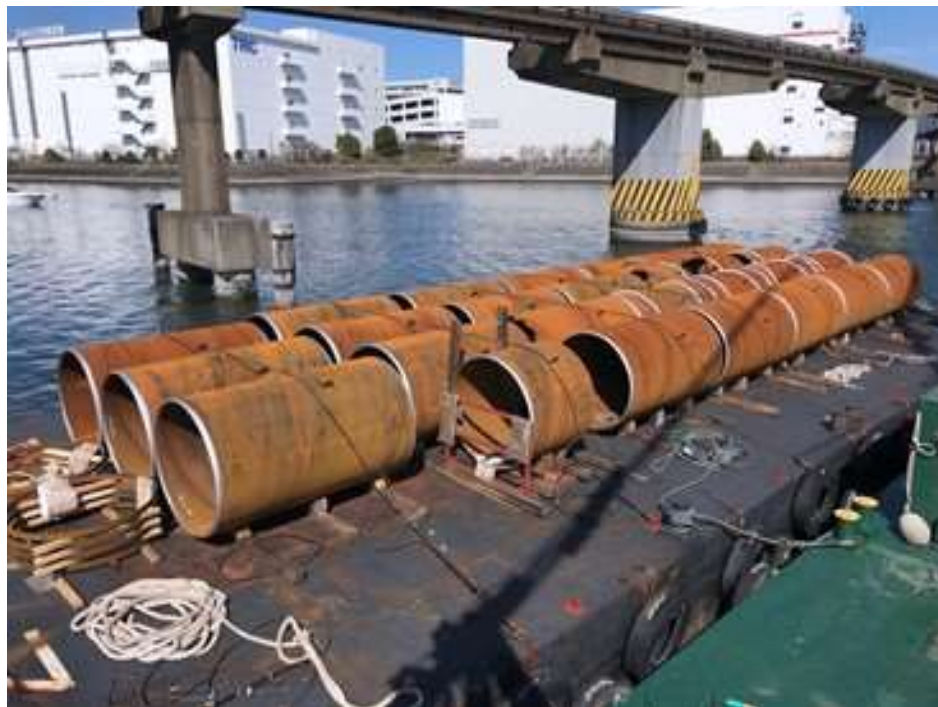
鋼管杭搬入 (令和3年3月)