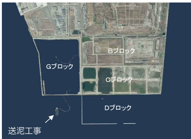
新海面処分場整備状況 令和2年4月