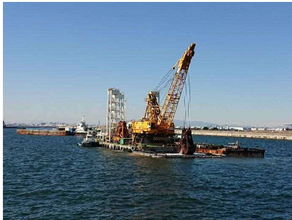
深掘工事 令和3年2月