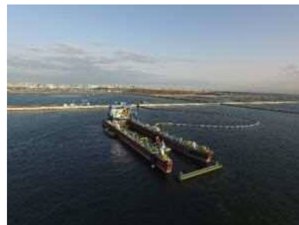
送泥工事（送泥船） 平成30年1月