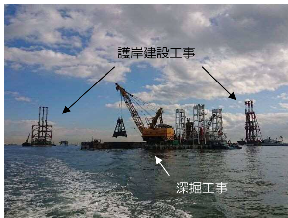
新海面処分場整備状況 令和2年12月