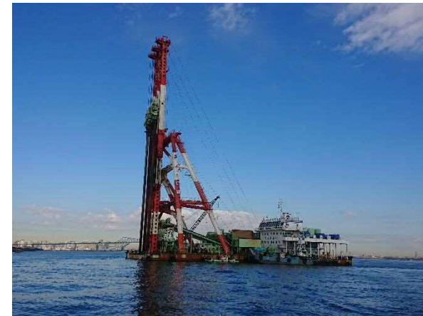
護岸建設工事（締固工） 令和2年12月