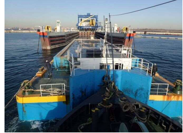
土砂投入(新海面処分場)