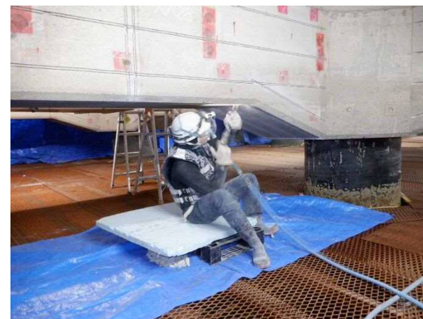
鉄筋腐食防止工(はつり状況) 令和3年2月