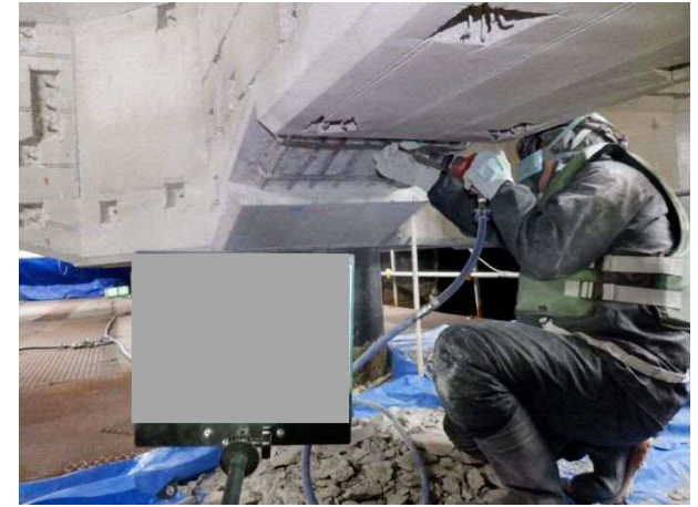
断面修復工(コンクリートはつり状況) 令和3年2月