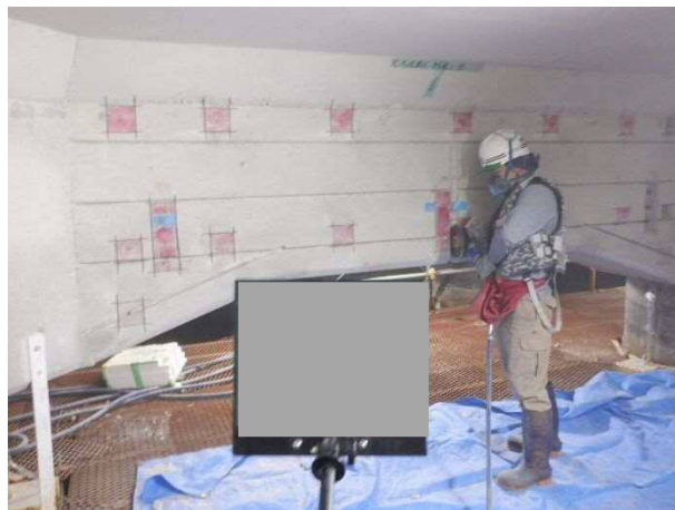
鉄筋腐食防止工(カッター切断状況) 令和3年2月