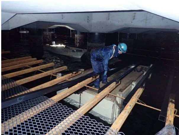
足場設置状況 令和2年12月