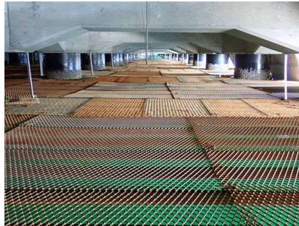
足場設置完了 令和3年1月