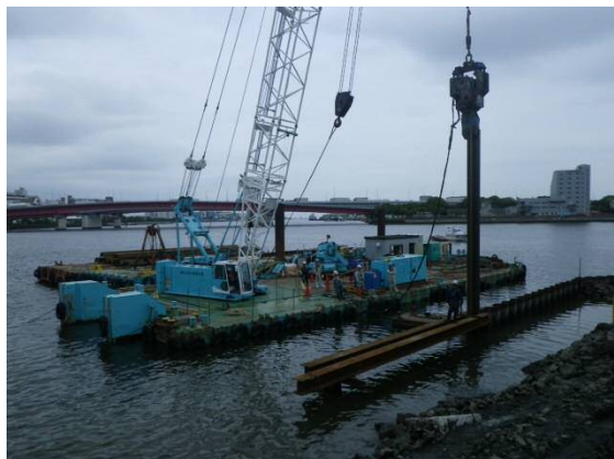
鋼矢板打設 平成29年5月