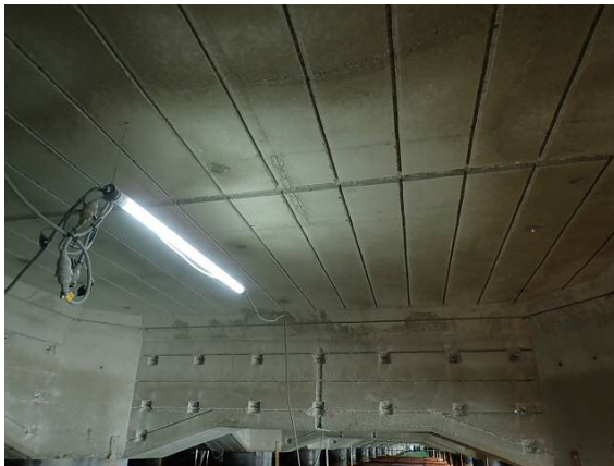
鉄筋腐食防止工（腐食防止材埋込み用溝切り） 平成30年1月