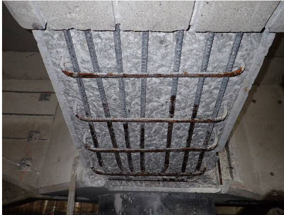
断面修復工（鉄筋の防錆処理） 平成30年2月