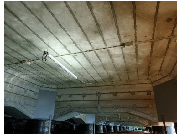
鉄筋腐食防止工（腐食防止材埋込み完了） 平成30年3月