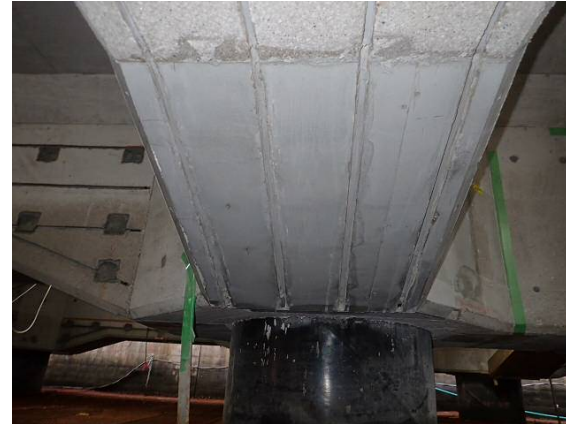
断面修復工（コンクリートの復旧） 平成30年3月