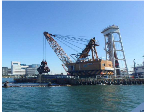
しゅんせつ工 平成29年11月