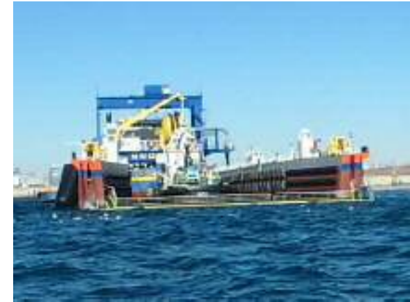
土砂投入（新海面処分場） 平成29年11月