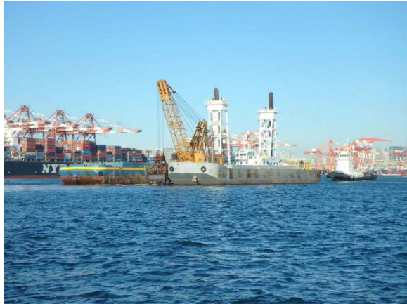
しゅんせつ工 平成29年11月