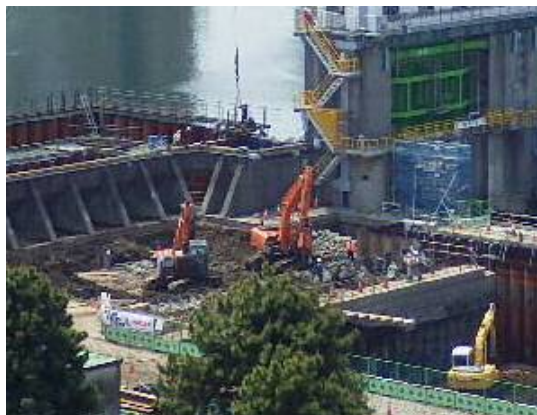
既設堤防取壊し（支障物撤去） 平成29年4月