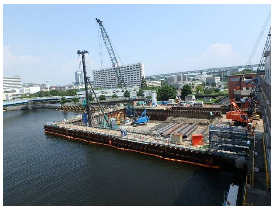
基礎工（杭打設） 平成29年8月