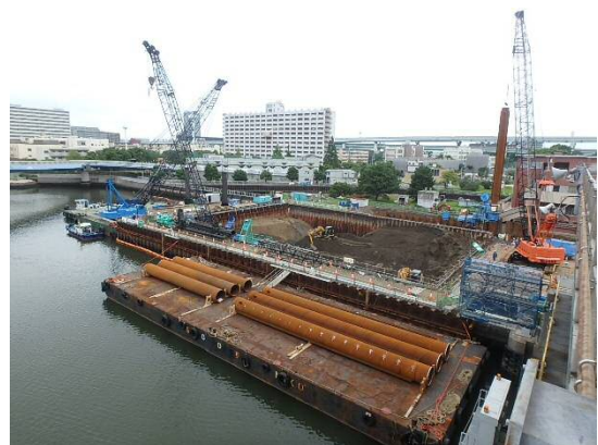
仮締切工 平成29年7月