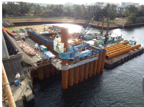
仮締切堤設置 平成29年2月