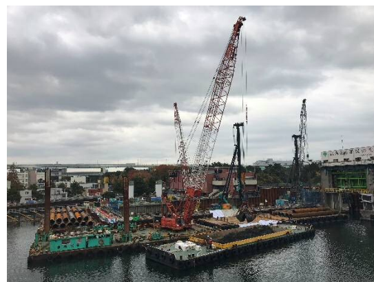
基礎工（杭打設） 平成29年11月