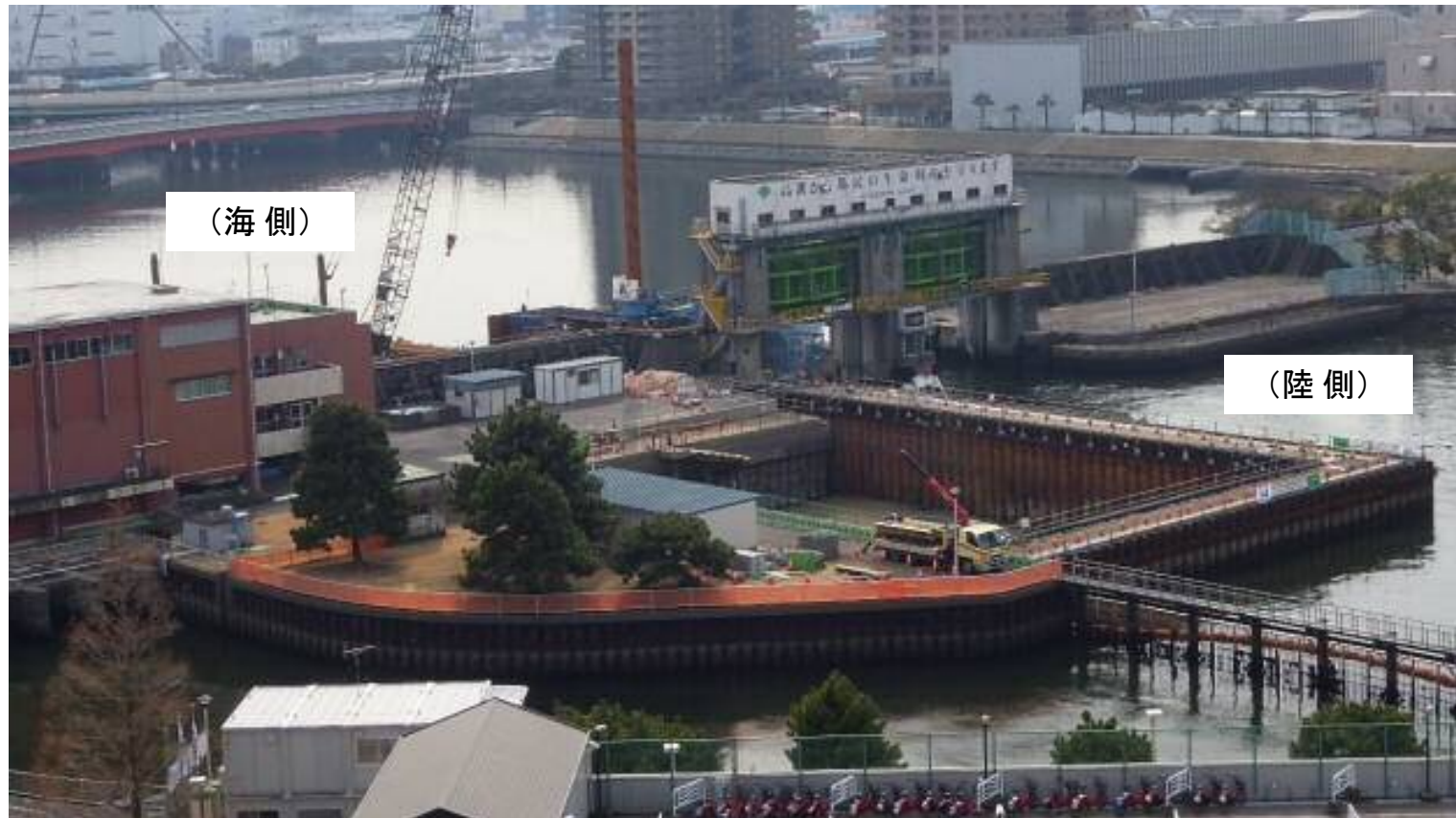
全 景 平成29年2月