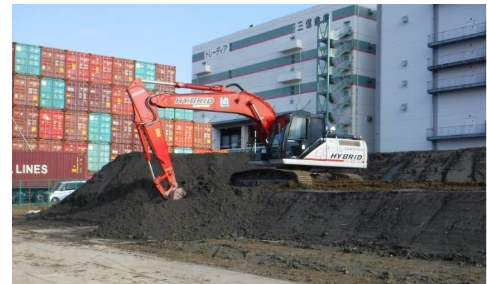
土砂整形 平成29年11月