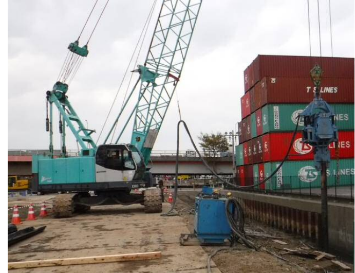
鋼矢板引抜 平成29年11月