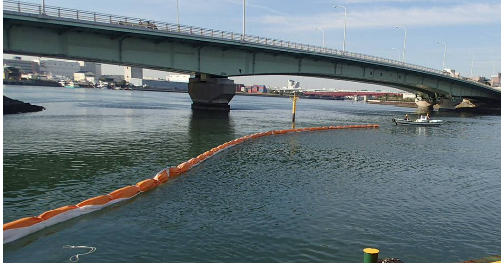
汚濁防止膜設置 平成29年11月