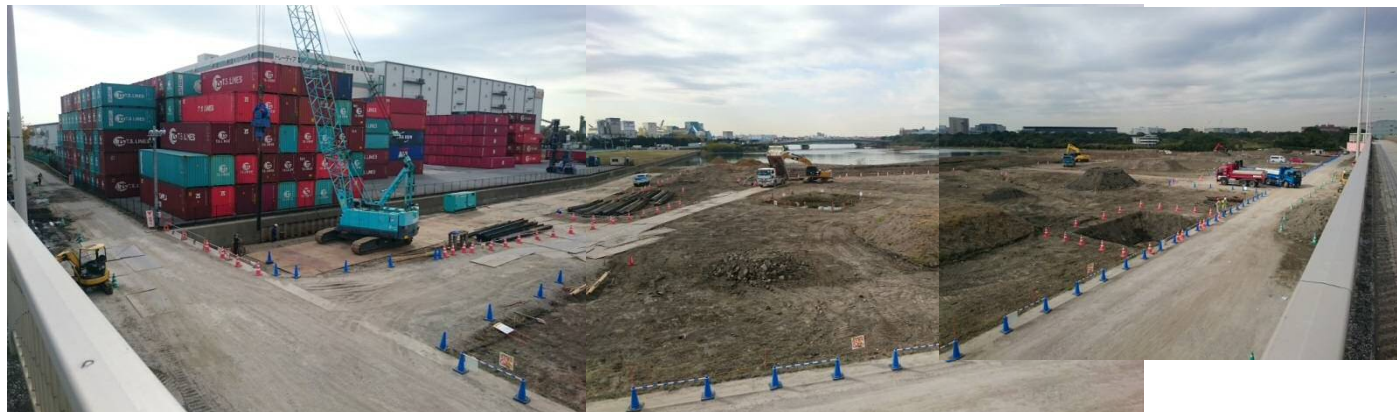
干潟部全景 平成29年11月