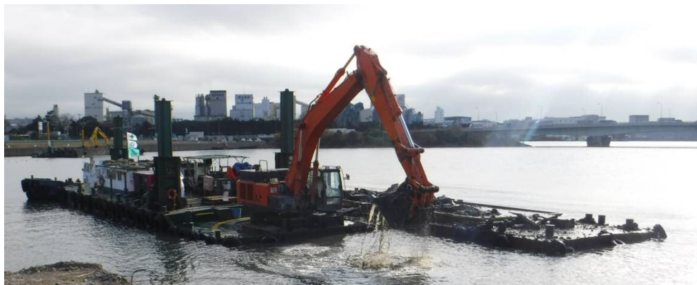
しゅんせつ 平成29年11月