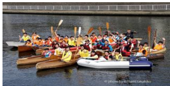
手作り船舶カーニバルの様子