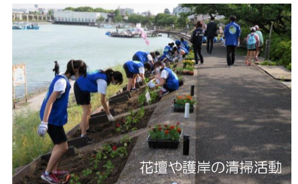
花壇や護岸の清掃活動