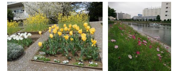
春のチューリップと秋のコスモス