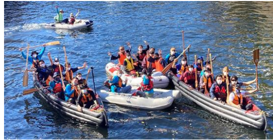
Eボートの試乗体験