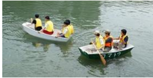
手作りボートの試乗体験

平成19年2月に設置されたポンツーンを活用して、ボートやカヌー、シーカヤックなどの水辺のツーリング体験を実施している。あわせて、手作りボートの進水式やEボート体験などの活動を行っている。体験会では、協議会の会員が、子供たちにパドルの使い方を丁寧に説明し、子供たちに楽しんで参加してもらえる人気のイベントである。