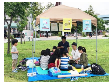
子供向けすごろくブース