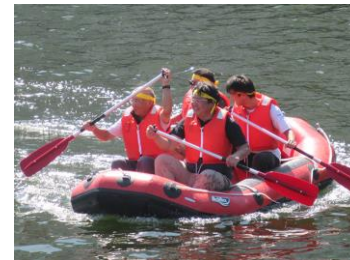
地域対抗ゴムボートレース