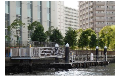
豊洲三丁目船着場

豊洲三丁目船着場として江東区が設置。運河ルネサンスでの運河クルーズ、芝浦工業大学の研究活動、区の催事等に利用できる。