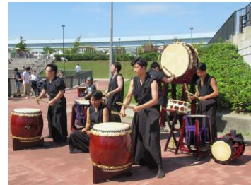
学生による和太鼓演奏