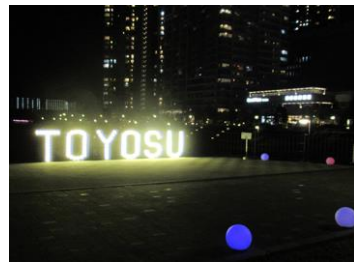
第2部のライトアップ