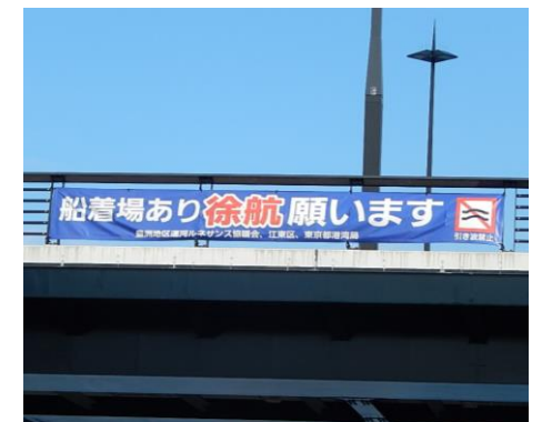
豊洲橋に設置した横断幕

平成23年7月に、運河ルネサンス協議会が安全航行の啓発のため、横断幕を設置した。