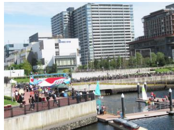
水彩まつりの様子