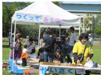
子供向け工作コーナー