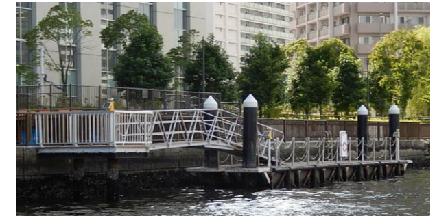
豊洲三丁目船着場

豊洲三丁目船着場として江東区が設置。運河ルネサンスでの運河クルーズ、芝浦工業大学の研究活動、区の催事等に利用できる。