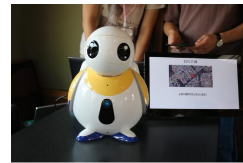
運河クルーズロボットガイド