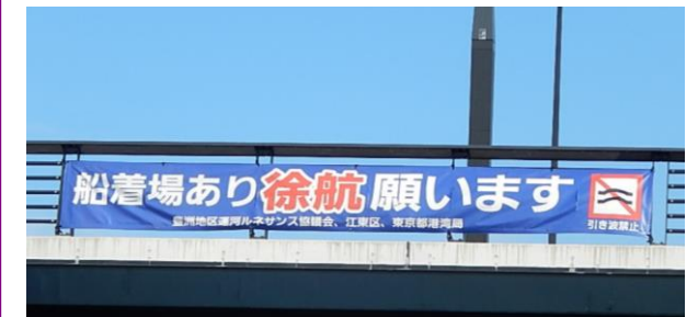
豊洲橋に設置した横断幕

平成 23 年 7 月に、運河ルネサンス協議会が安全航行の啓発のため、横断幕を設置した。