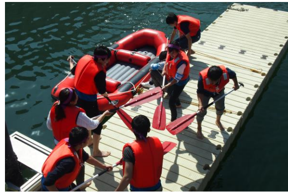
地域対抗ゴムボートレース