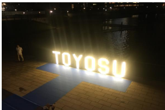
ライトアップされたオブジェ

夜の第 2 部では、豊洲水彩シネマを開催し、多くの人々が屋外での映画鑑賞を楽しんだ。