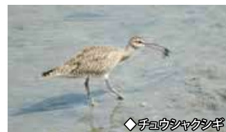
◆チロウシヤクシヤク