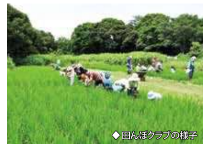
◆田んぼクラブの様子

東アジア・オーストラリア地域 フライウェイ・パートナーシップ (渡り性水鳥保全連携協力事業) 日本の渡り鳥が移動する地域のアメリカ、ロシア、中国、韓国、東南アジア、オーストラリアなどの国々やNGOがいっしょになって、水鳥やその生息地となっている湿地の保全を進める国際協力事業。東京港野鳥公園は、谷津干潟や大阪南港野鳥園、熊本県の球磨川河口などととも、シギ・チドリ類の重要な生息地として参加しています。