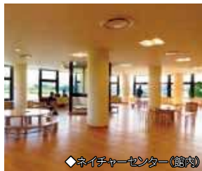
◆ネイチャーセンター(館内)