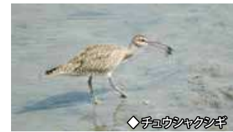
◆チロウシヤクシヤク