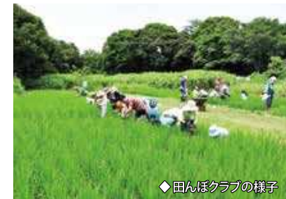
◆田んぼクラブの様子

日本の渡り鳥が移動する地域のアメリカ、ロシア、中国、韓国、東南アジア、オーストラリアなどの国々やNGOがいっしょになって、水鳥やその生息地となっている湿地の保全を進める国際協力事業。東京港野鳥公園は、谷津干潟や大阪南港野鳥園、熊本県の球磨川河口などととも、シギ・チドリ類の重要な生息地として参加しています。