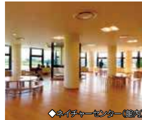
◆ネイチャーセンター(館内)