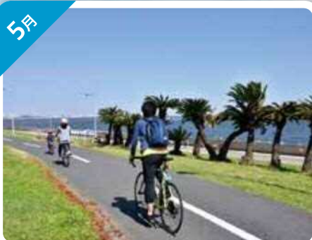
サイクリング (若洲海浜公園)