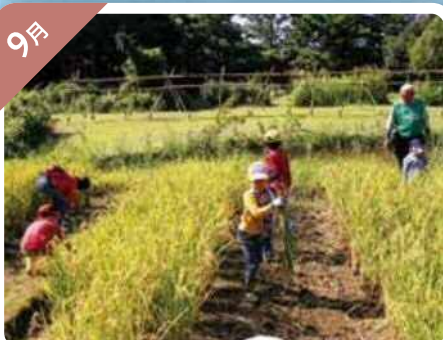
自然生態園における稲刈り (東京港野鳥公園)