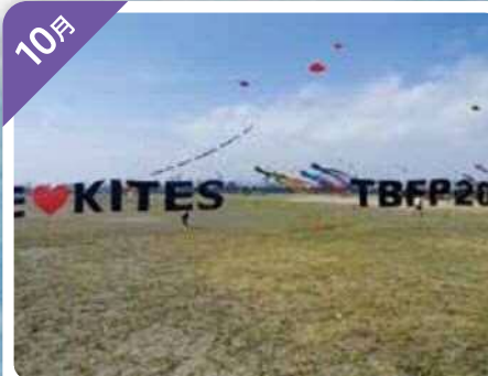
スポーツカイトの全国大会 (葛西海浜公園)