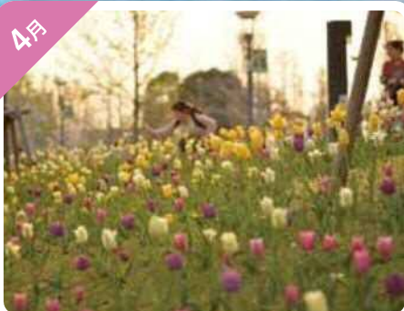
春を彩るチューリップフェスティバル (シンボルプロムナード公園)