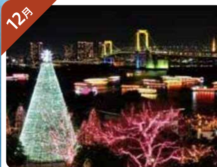
イルミネーション (お台場海浜公園)