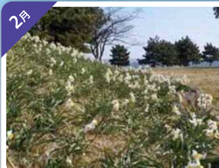
水仙 (城南島海浜公園)