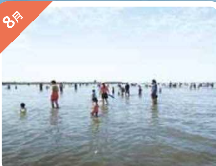
海水浴体験 (葛西海浜公園)