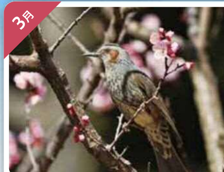
梅とヒヨドリ (東京港野鳥公園)