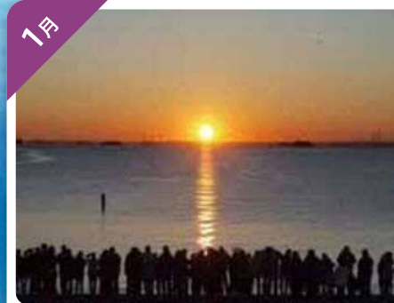
初日の出 (城南島海浜公園)