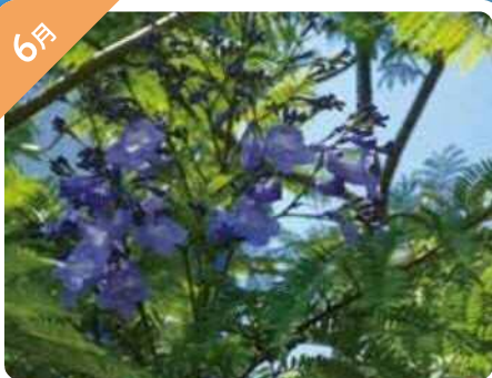
ジャカランダ (夢の島緑道公園)