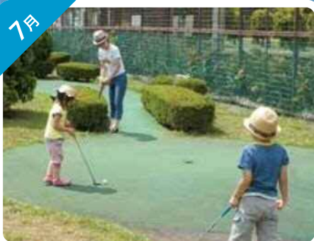
パターゴルフ (辰巳の森海浜公園)