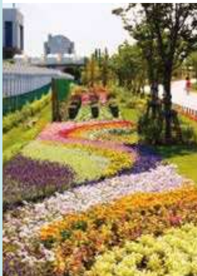
夏を彩る「おもてなし花壇」