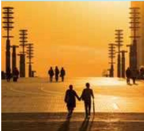
夢の大橋から眺める臨海副都心の夕暮れ

セントラル広場から石と光の広場までを東西方向に結びます。「東京テレポート駅前交流広場」はヘブンアーティストの会場として登録されています。