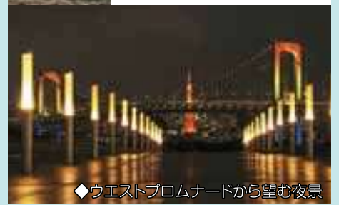
◆ウエストプロムナードから望む夜景

平成10年に開催された「日本におけるフランス年」を記念して、フランスから贈られた像。台座と合わせて約27mの高さで、見上げるとかなりの存在感です。