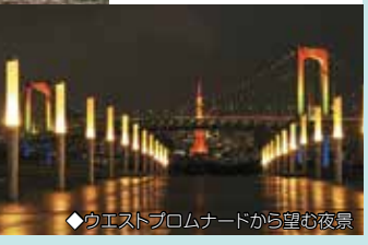
◆ウエストプロムナードから望む夜景