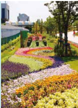
◆夏を彩る「おもてなし花壇」

「夢の広場」は、東京レポート駅と夢の大橋の間の約6,000㎡の芝生地です。(多彩なイベントが実施されます。)