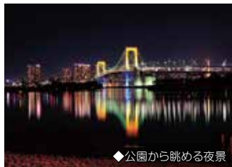
◆公園から眺める夜景