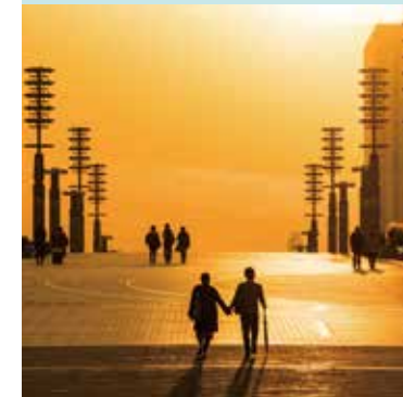
◆夢の大橋から眺める臨海副都心の夕暮れ

センタープロムナード セントラル広場から石と光の広場までを東西方向に結びます。「東京レポート駅前交流広場」はヘブンアーティストの会場として登録されています。