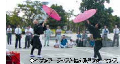
◆ヘブンアーティストによるパフォーマンス

イーストプロムナード 東京ビッグサイトから有明テニスの森公園までを南北方向に結びます。中央の「石と光の広場」はヘブンアーティストの会場として登録されています。