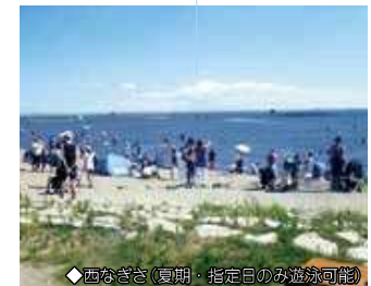
◆西なぎさ(夏期・指定日のみ遊泳可能)