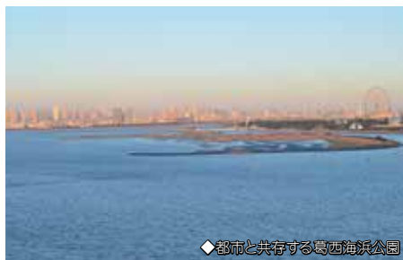
◆都市と共存する葛西海浜公園

※ワイズユース(Wise use)=賢明な利用 湿地の生態系を損なわず、持続的に維持・利用していくことにより、人間の生活を豊かにするとともに、次世代へと継承していくことを目指しています。