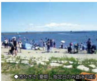
◆西なぎさ(夏期・指定日のみ遊泳可能)