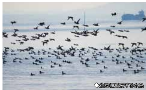
◆公園に飛来する水鳥

※ここで紹介する生き物は来園時に必ずしもご覧になれるとは限りませんのでご了承ください。