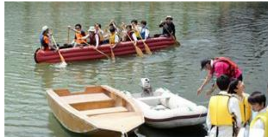
Eボートの試乗体験