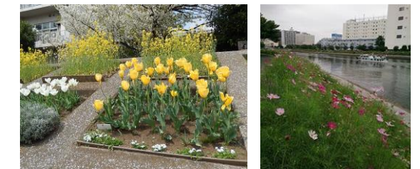
春のチューリップと秋のコスモス