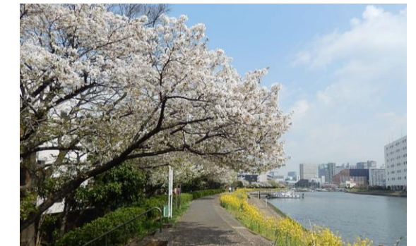
春の桜と菜の花の花海道