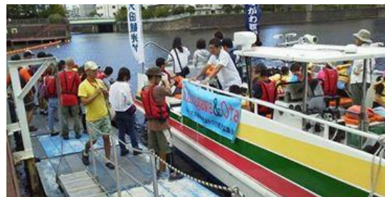
大田区観光協会との交流会

また、平成27年度より、「手作り船舶フェスティバル」を開催している。平成31年度は第5回を迎え、小学生の親子や多くの中学生が参加した。イベントではポリプロピレン樹脂製の段ボールを使用して自分たちで制作したカヌーを実際に海に浮かべ、水辺を楽しんだ。