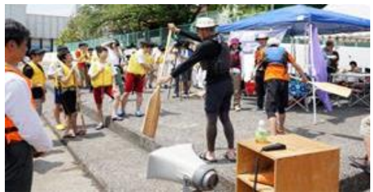
体験会でのパドルの使い方説明