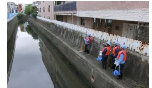
花壇や護岸の清掃活動