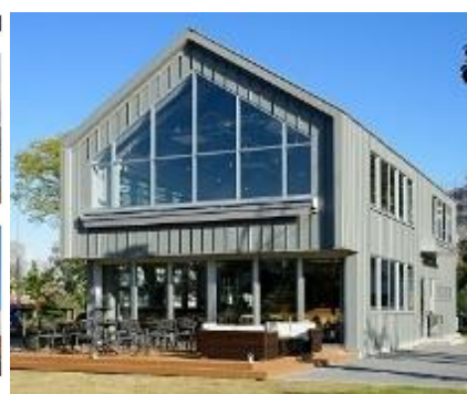
コネクトハルミ (晴海ふ頭公園内カフェ)