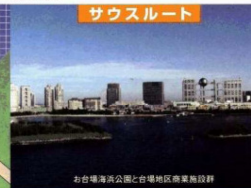
お台場海浜公園と台場地区商業施設群