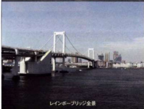
レインボーブリッジ全景