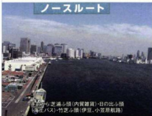
手前から芝浦ふ頭(内貿雑貨)・日の出ふ頭 (海上バス)・竹芝ふ頭(伊豆、小笠原航路)