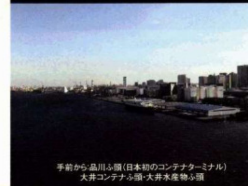
手前から品川ふ頭(日本初のコンテナターミナル) 大井コンテナふ頭・大井水産物ふ頭