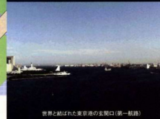
世界と結ばれた東京港の玄関口(第一航路)