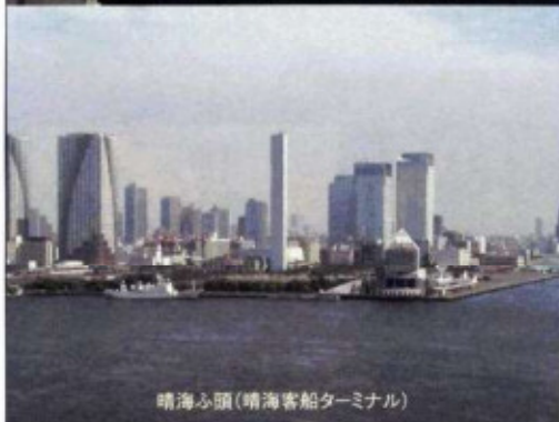
晴海ふ頭(晴海客船ターミナル)