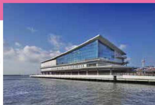
東京国際クルーズターミナル

臨海副都心に関する情報を多言語で提供するタッチパネル式の案内板。商業施設やホテル、展示施設等、街の様々な場所から最新の情報を発信します。