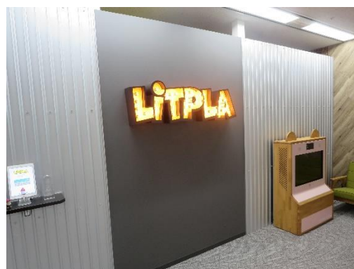
スタートアップの新オフィス整備