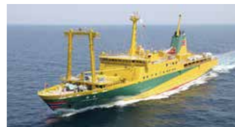
橘丸 Tachibana Maru