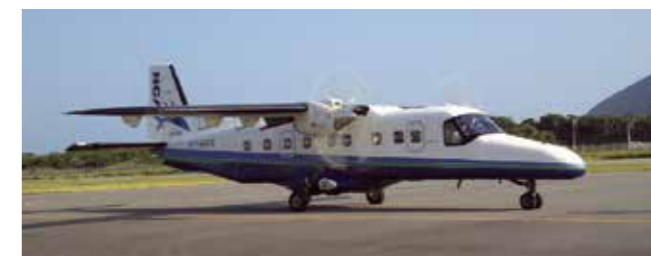
ドルニエ228 (新中央航空) Dornier 228 (New Central Airservice)