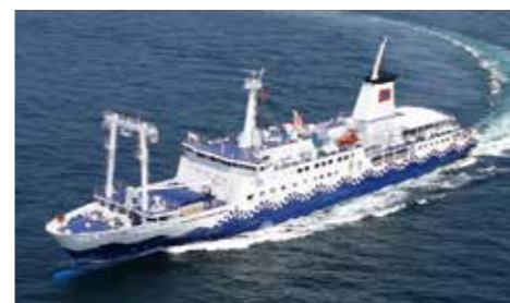
さるびあ丸 Salvia Maru

*セブンアイランド結の場合 *In the case of Seven Islands Yui