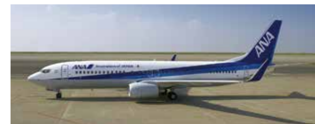
B737-800 (全日本空輸) B737-800 (All Nippon Airways)