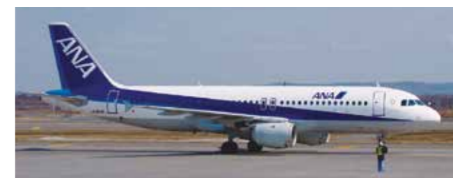
A320 (全日本空輸) A320 (All Nippon Airways)